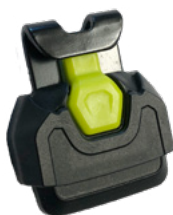
28mm-Sleeve mit Schnalle

Um weitere Reklamationen und Probleme im Einsatz auszuschließen, ruft EDELRID alle Besitzer von TREEREX Gurten dazu auf, über service@edelrid.de unter Nennung der benötigten Anzahl (3 Stück pro Gurt) und einer Lieferadresse kostenlos diese Nachrüstbauteile zu bestellen. Die Nachrüstung ist einfach und kann von jedem Anwender selbst durchgeführt werden.